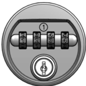
1. Persönlichen Code eingeben