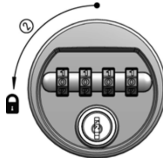
2. Schloss waagrecht drehen bis zum Anschlag (Code verwischt)